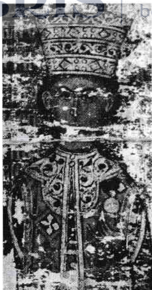
Mara Branković, ilustrație dintr-un hrisov [1429]

Mara a făcut tot posibilul ca mănăstirea Hilandar să fie așezată sub protecția lui Basarab al IV-lea Țepeluș (înainte de 1481) 115 și apoi al lui Vlad al IV-lea Călugărul (pe la 1487) 116 , dușmanii „transalpini” ai lui Ștefan 117 , cel intitulat și „voievod al Serbiei” de către Republica Sfântului Marcu după victoria sa de la Vaslui 118 . Dintre marile doamne de rit bizantin din a doua jumătate a secolului al XV-lea 119 , poate numai Zoe (Sofia) Paleolog, a doua soție a lui Ivan al III-lea al Moscovei, l-a respins și urât mai mult pe Ștefan al III-lea cel Mare 120 .